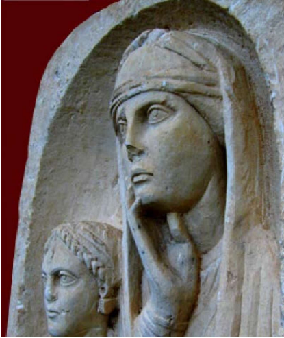
Şekil 2. Boston Müzesi - Romalı Kadın Heykeli

Diğer yandan eski Roma'da başörtüsü olmadan dışarı çıkan bir kadının başına bela geldiği takdirde kanunlar tarafından korunma hakkını kaybederdi. 10 (Şekil 2.)