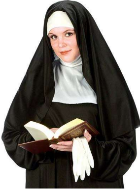
Şekil 8. Hristiyan Rahibe

Hristiyanlık'ta önceleri tüm kadınları kapsayan baş örtme geleneğinin bugün sadece kendisini dine adayan kesimlerce yaşatıldığını görmekteyiz. (Şekil 8)