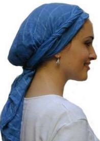
Şekil 6. Yahudi Bir Kadın

Bunun için kadınlar, düğünlerde olduğu gibi yüzlerini tamamen örten peçeler kullanmaya başlamışlardı. 15 (Şekil 5.)