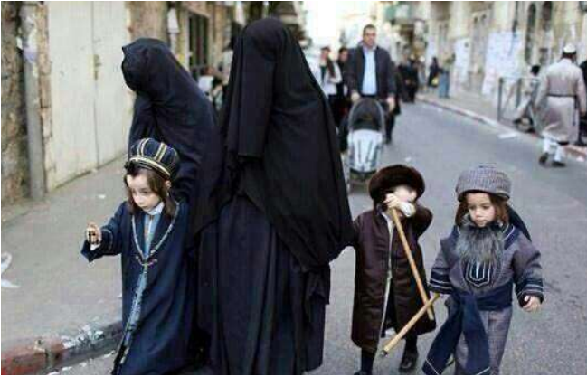
Şekil 5. Yüzleri Tamamen Örtülü Yahudi Kadınlar

Bununla beraber eskiden İbraniler Müslüman kadın ve erkeklerden kendilerini ayırt etmekte zorlanıyorlardı.