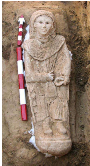
Şekil 1. Kahire'de Bulunmuş Antik Mısır'a Ait Bir Mumya

Eski Yunan'a gelirsek, orada da durumun çok farklı olmadığını görürüz. Antik Yunan medeniyetinde hür ve