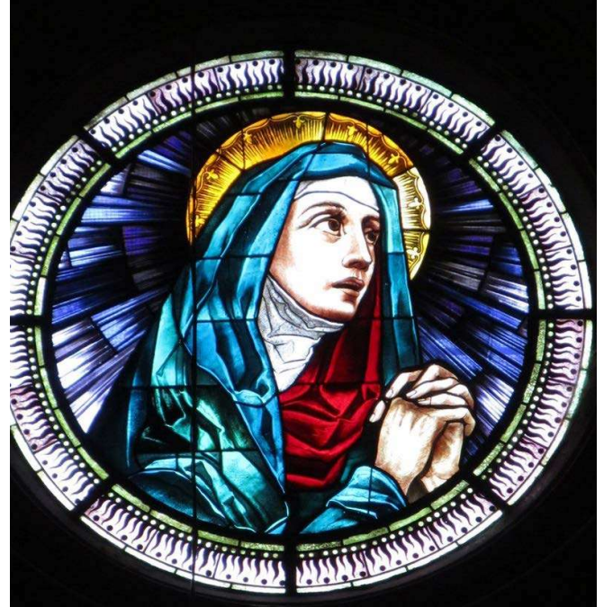
Şekil 7. Bir Kilisedeki Meryem Ana Tasviri

Hristiyanlık, itikadî bazı ihtilaflar dışında Yahudilik'ten farklı bir din değildir. Tarihi metinler incelendiği zaman, ne İsa a.s.'ın ne de onun öğrencilerinin Yahudileri farklı bir dine davet ettiklerini görüyoruz. İsa a.s.'ın yaşadığı dönemde "Hristiyan" ismi de bilinmiyordu. Bu isim, sonraları ortaya çıkmıştır. Dolayısı ile Hristiyanlık'ın başörtüsüne bakışı, Yahudilik'ten çok da farklı değildir. Bugün hangi kiliseye giderseniz gidin, Meryem a.s. ile ilgili tasvirlerin başı örtülü olduğunu görebilirsiniz. (Şekil 7)