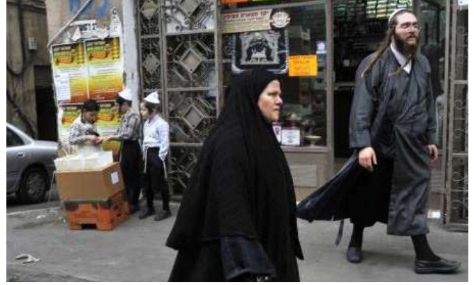
Şekil 3. Yahudi Bir Kadın

Yahudilik'te kadının saçları sadece zinet yeri olarak görülmez, buna ziyade olarak kadının cinsel istek uyandıran bölgelerinden birisi olarak kabul edilir ve çıplaklıkla ilgili olarak kadının vücudunun en mahrem yerlerinden birisi olduğuna işaret edilerek, saçların mutlaka örtülmesi gerektiği vurgulanır. 11 (Şekil 3.)