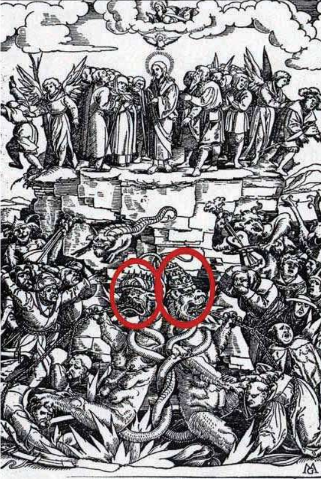
Şekil 2 - Resimdeki iki canavardan birisi Papa'nın kavuğunu diğeri Müslüman Sarığı giyiyor. 16 yy. Matthias Gerung -Almanya

Katolik kilisesi Vahiy bölümünde anlatılan şeylerin birer