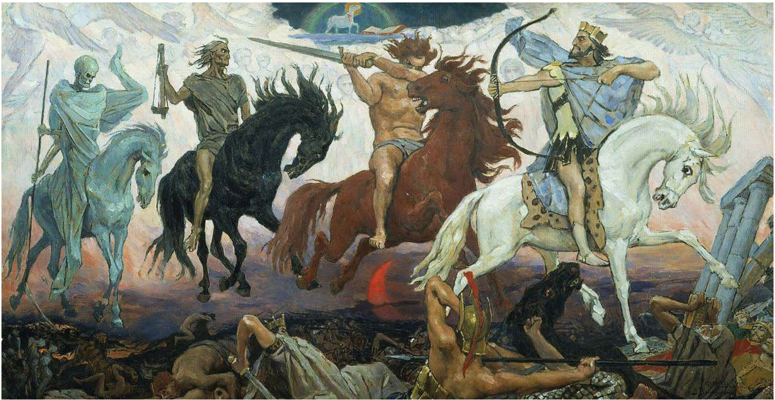
Şekil 4 - Yeryüzünde Kaos olurken, mühürleri açan İsa (kuzu) figürü bulutlar arasında vurgulanmış. Victor Vasnetsev 19 yy.

"Savaş gürültüleri, savaş haberleri, bunların olması gerektiği... Ulusun ulusa, devletin devlete açacağı savaşlar (Markos 13:7-8) hakkında haberler duyacağız. Yine de bunlar o kadar da kötü değildir. Mührü açan Rab İsa Mesih'tir. Tarihin dizginlerini elinde tutan odur. Herşey, evet her şey, onun amaçlarını gerçekleştirmesini, onun egemenliğinin gelişine katkıda bulunmasını sağla-