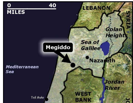
Şekil 1 - Megiddo Dağı

Bu kehanet hakkında Hristiyan mezhepleri arasında