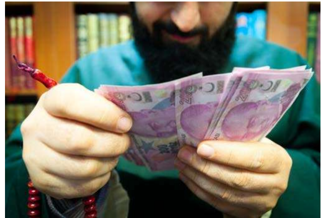
Model: Nizamettin Baračkılıç, Kamera: Rauf Mehmet

1. Altınlar ne şekilde teslim edilirse edilsin geriye 1 kg'lık külçe altın yahut da darphane tarafından üretilen çeyreklik cumhuriyet ziynet altını olarak geri alabilirsiniz. Bunun için de belli tarihlerde vade sonunda altınımı fizikî olarak geri almak istiyorum diye önceden başvurmak gerekiyor. Bunu altınlarınızı teslim ederken talep etmek zorundasınız. Bunu atlarsanız, altınınızı asla fiziken geri alamazsınız. Başvuru yaparsanız günü geldiği zaman rafineriden o altının çıkış ve teslim