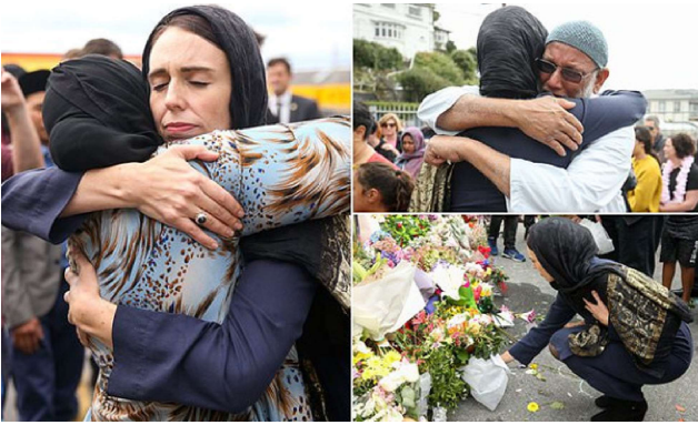
Yeni Zelanda Başbakanı Jacinda Ardern, başörtüsü takarak saldırıda hayatına kaybedenlerin ailelerini ziyaret etti.

Başbakan Jacinda Ardern ise namaz öncesinde kısa bir konuşma yaptı ve bu konuşmasına Hz. Muhammed'in bir hadisiyle başladı. Akabinde dünyanın farklı ülkelerinde namaz kılan Müslümanları korumak için Gayr-i Müslim insanlar camilere akin ettiler. Müslümanlara destek olduklarını göstermek için vakit namazlarda camilerin içinde oturan, okunan Kur'an-ı Kerim'i dinleyen, hayatını kaybeden insanların ailesine destek vermek için onlarla zaman geçiren birçok insanı görmek mümkündür.