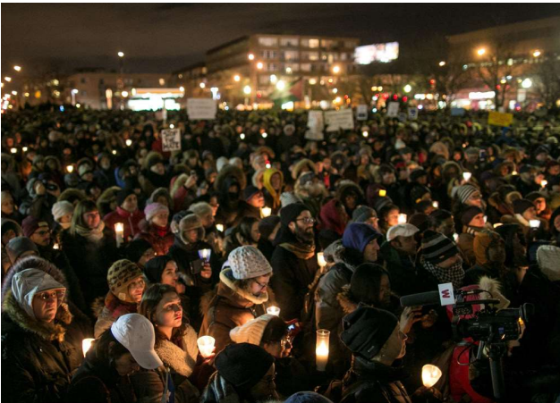
Kanada Dinî Ayrımcılığa Karşı Anma Günü Etkinliklerinden

30 Ocak 2017 tarihinde Kanada'nın Quebec eyaletinde cami olarak da kullanılan, Quebec İslam Kültür Merkezi'nde yatsı namazı için toplanan cemaate üç kişi tarafından silahlı saldırı düzenlendi. Gerçekleştirilen saldırıda 6 kişi öldü, 8 kişi yaralandı. Bölge halkı, Müslümanların namazlarını güvenli bir şekilde eda etmeleri için Essalam Camii'nin etrafında el ele tutuşup Müslüman cemaate 'kalkan' oldu. Toplanan halk günlerce cami bölgesini terk etmedi. Dünyanın birçok yerinden bölgeye gelen ve birçoğu Müslüman olmayan topluluk camilere girerek Müslümanlarla birlikte dualar ettiler.