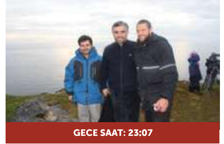
GECE SAAT: 23:07

Gökyüzünde Güneş var ama oluşan aydınlık, kar görüntüsünde parlantılı ve soğuktu. Gündüz kısa kollu gömlek giyerken gece kışlık elbise giymek zorunda kaldık. Beyaz gecelerdeki sükunet ile karanlık gecelerdeki sükunet arasında bir fark yoktu, canlılar yuvalarına çekilmiş uyuyorlardı.