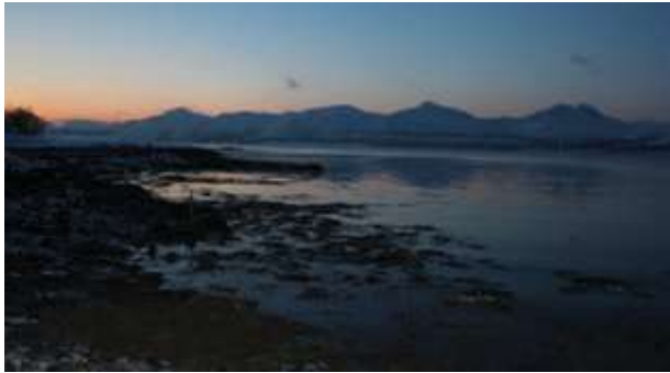
İsfâr Vakti / Sivil Tan

Güneş'in batmasından sonra ve doğmasından önce, en parlak yıldızların görülebileceği vakit Güneş'in ufka uzaklığının 6° olduğu sivil alacakaranlıktır. Denizciler gözleme, notik alacakaranlıkta başlar sivil alacakaranlıkta son verirler 20 .