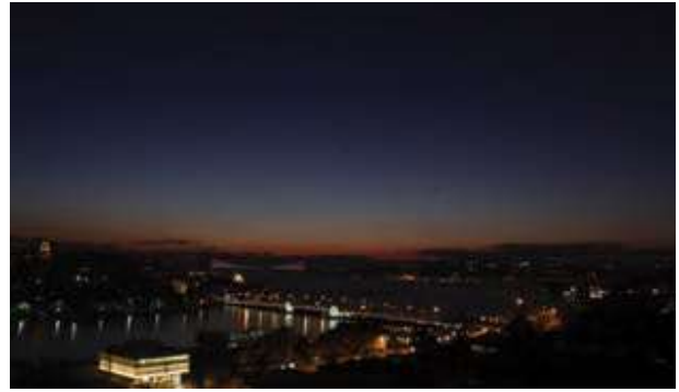
İstanbul'da Süleymaniye Camii yanı. Şehir ışıklarının görüntüye herhangi bir etkisi yok.

ancak evlerden yapılabilir. Şehir ışıklarının gözleme herhangi bir etkisi olmaz.