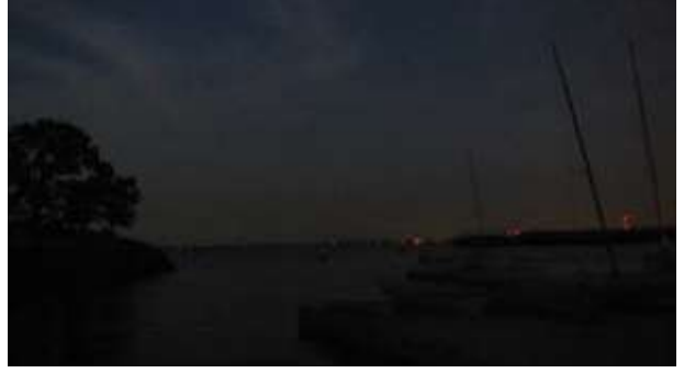
Notik veya Denizci Tanı /Nautical Twilight

lamayacak kadar karanlık olur. Denizci tanı, karşıdan gelen bir geminin veya kara parçasının fark edilebileceği andır.