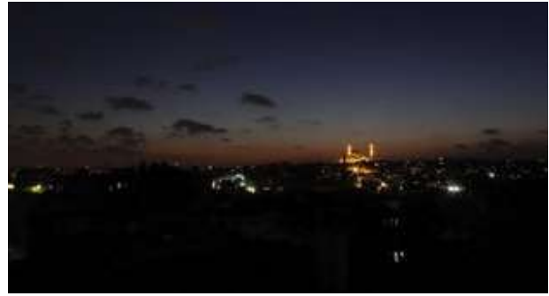
İstanbul Fatih'te akşam namazının sonu ve yatsının başlangıcı

Rafi b. Hadîc şöyle demiştir: “Allah'ın Elçisi sallallahu aleyhi ve sellemle akşam namazını kılar da birimiz mescitten ayrılırsa okunun düştüğü yeri kesin olarak görebilirdi 9 .”