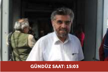
GÜNDÜZ SAAT: 15:03

Altta resimler, enlemi 69° 40' olan Norveç'in Tromso kentinde, 22 Haziran 2011'de çekilmiştir.