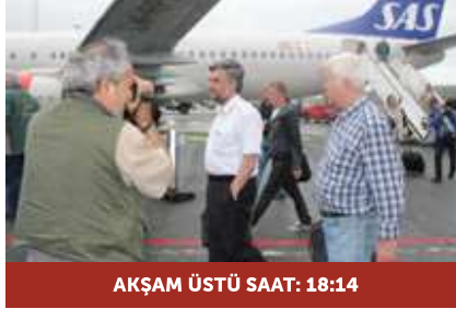
AKŞAM ÜSTÜ SAAT: 18:14