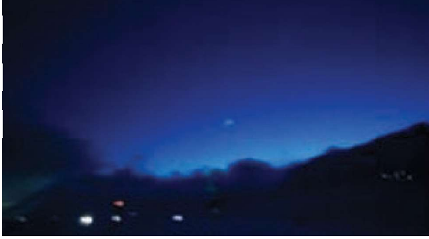
Svalbard'da Güneş ufku 12° altında ama bulutlu bir gündüz.

Akşamın alacakaranlığı ile birlikte duhânın dalga yüksekliği azalır ve bir sükunet başlar. Allah Teâlâ şöyle buyurmuştur: