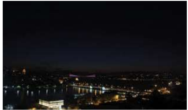
Seher Vaktinin Sonu

Seher vaktinde Güneş'ten gelen kızıl ve beyaz ışıklar arttıkça, üstten aşağıya doğru bir kubbe görüntüsü oluşur ve doğu ufku, boydan boya sarar. Güneş ufka 10 derece yaklaştığında ufuk çizgisi net olarak gözükmeye başlar. Denizciler yollarını belirleme amacıyla bu saatte gözleme başladıkları için ona rasat tanı (observation twilight) derler. Bu aydınlığı gören insanlar sabah namazı vaktinin girdiğini sandıklarından ona fecr-i kazib, yalancı fecr denir.