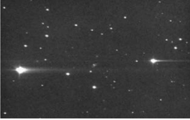
Diyanet'in İmsak Vakti

Güneş'in doğmasından önce veya batmasından sonra ufka 18^\circ daha az uzaklıkta olduğu vakitlerdir. Bu vakitte her yerin karanlık olması ve en zayıf ışıklı yıldızların dahi görülebilmesi sebebiyle 19 uzay bilimciler yıldız gözlemine bu saatte başlar ve sabaha doğru Güneş'in ufka yakınlığı 18^\circ üstüne çıkıncaya kadar gözlemi sürdürürler.